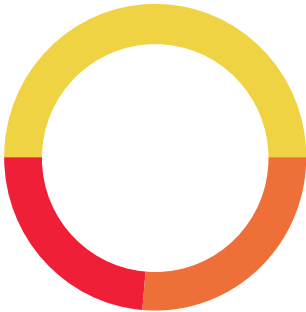
ENLACE GLOBAL PM S/INTERESES (Saldo inicial de $1.00)